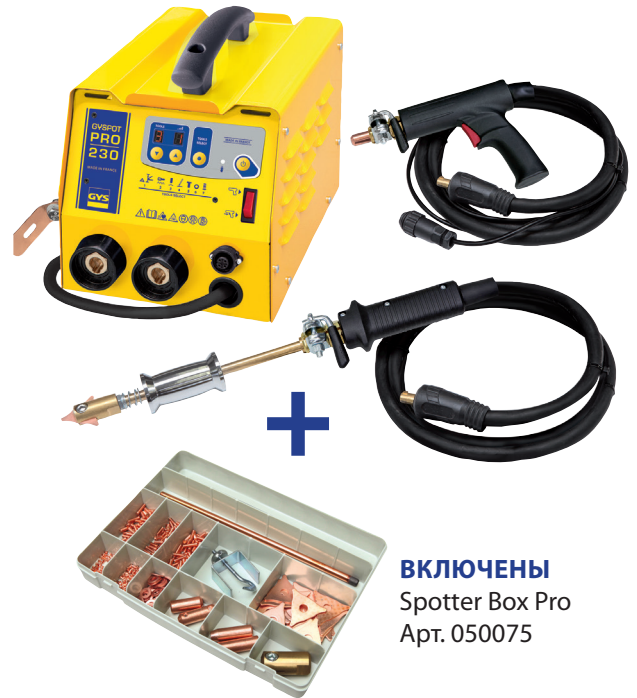
ВКЛЮЧЕНЫ Spotter Box Pro Арт. 050075

массы: 2 м сварки: 2 м + 3 м питания: 8 м