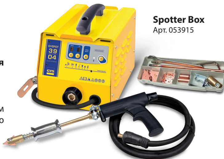
Spotter Box Арт. 053915

Сварная точка совершается автоматически простым контактом между инструментом и деталью, которую нужно выправить.